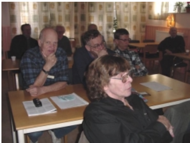
SM3-mötet i Gävle

arbeta vidare, för att leva upp till de förväntningar som ställs på en modern amatörradioklubb. Utdrag ur årsmötesprotokollet samt styrelsens nya sammansättning kan Du läsa på sidan 7.