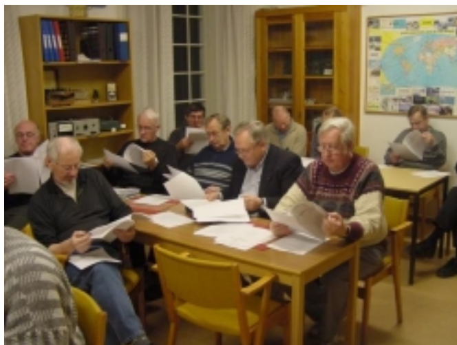
Årsmöte på SK3BG, alla studerar räkenskaperna