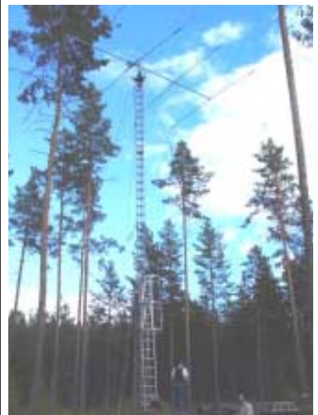
Den portabla masten i Utanede.

Försommarens arbete har främst varit inriktat på att montera upp en mast med antenner på det område där vi erhållit bygglov. I avsaknad av ekonomi har SK3JR/Jemtlands Radioamatörer och SL3ZV/FRO lånat ut en militär mastvagn med en portabel mast som kan nå en höjd på totalt 30 meter med tillhörande rotor och 5 el Fritzell beam. De har även lånat ut en ICOM IC735-Line med antennavstämningseenhet och slutsteg. Målsättningen var att allt antennarbete skulle vara klart till midsommardagen. Mastuppsättningen påbörjades den 24 maj och fortsatte den 4 juni. Den 16 juni kunde vi fästa rotorn och 5